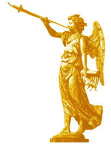
St. Anna Augsburg